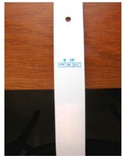
The technical specifications of the limbs are written on the internal part of the bottom limb.

Bei einem nicht gespannten Recurvebogen zeigen die Wurfarmspitzen zur Scheibe (nicht zu Dir). Aufgrund einer früheren FITA Regel ist bei den meisten Bogen die innere Seite (zeigt zu Dir) des oberen Wurfarmes unbeschriftet, während die Innenseite des unteren Wurfarmes mit den technischen Daten (Zuglänge und Zuggewicht) beschriftet sind (siehe nebenstehendes Bild).