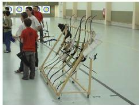
Movable and collective bow stand.

Ein Pfeil wird nur dann aufgelegt, wenn Du an der Schiesslinie bist und das Signal dazu gegeben worden ist (bedeutet, jedermann ist hinter der Schiesslinie). Du stehst in Grätschstellung über der Linie oder hast beide Füße auf der Linie, bevor Du den Pfeil auflegst.