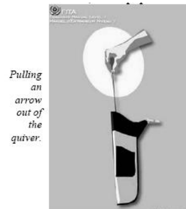
Pulling an arrow out of the quiver.