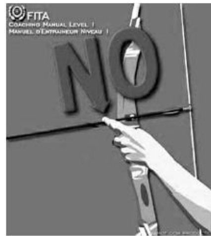
Finger pressure damaging the arrow